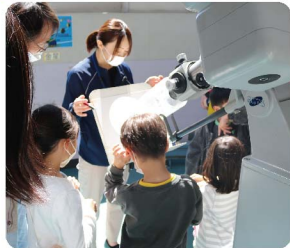
太陽の黒点や金星の観測をします。 (毎週土曜日開催 ※7月、8月、9月は高温のため中止)