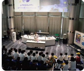
楽しい科学の実験ショー。(毎日開催)