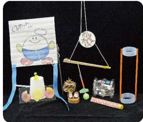
簡単な工作を楽しく作る教室。 参加費：1個100円。(日祝開催)